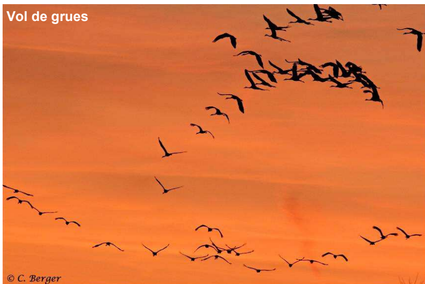
Vol de grues

Mais la vedette de l'hiver est sans conteste le Pygargue à queue blanche. Il est le 3ème plus grand aigle du monde... Sur les grands lacs de Champagne humide, il passe son temps à pêcher, chasser et à se reposer. On le voit alors posé sur un arbre ou une souche en attente d'une proie. Son envol provoque la panique chez les oiseaux des alentours (Vanneaux huppés, Sarcelles d'hiver...) à raison d'ailleurs, car il est assez puissant pour maîtriser jusqu'à des oies sauvages.