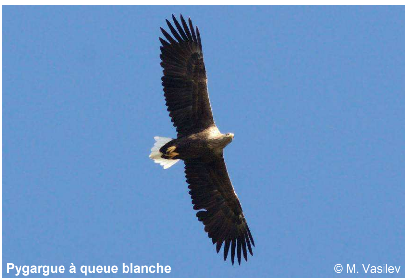
Pygargue à queue blanche